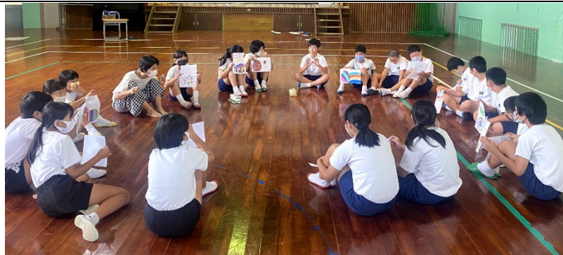
自分の気持ちを表した絵を紹介して共有します