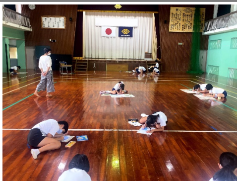
自分の気持ちを絵にします

天気が悪くて十分な練習はできませんでしたが、7月11日（土）の校内水泳大会は天気に恵まれ、賑やかに開催することができました。水泳が得意な子もそうでない子も、真剣に、一生懸命泳ぎました。