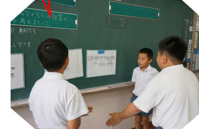
3.4年生、一緒に振り返りの時間

本校は、令和4年度から児童に確かな学力をつけるために、算数科の研究に取り組んでいます。各担任が授業を提供し、全職員で研修を深めていきます。6月30日は、3・4年生の研究授業を行いました。複式学級におけるガイド学習の効果的な進め方やタブレットの有効的な活用法について研究しながら授業づくりを行っていきます。少数の強みを生かし、個を大切に学習指導をチーム中津川で取り組んでいきます。