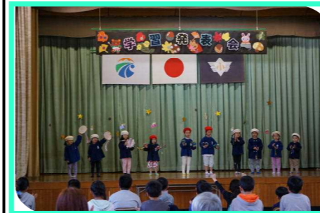
保育園『パワフルパワー 中津川保育園』