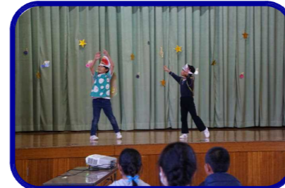
2年 劇『スイミーとメカ』