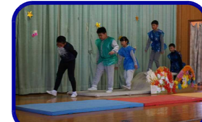
3. 4年 劇『三年とうげ』