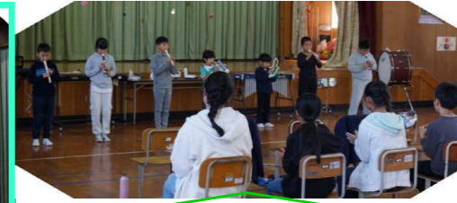
合唱「いろんな木の実」 合奏「パフ」