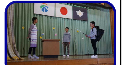
5. 6年 劇『10年後の夢』