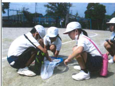
教室の外での発見