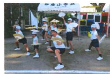
保育園児ダンス「Life goes on」