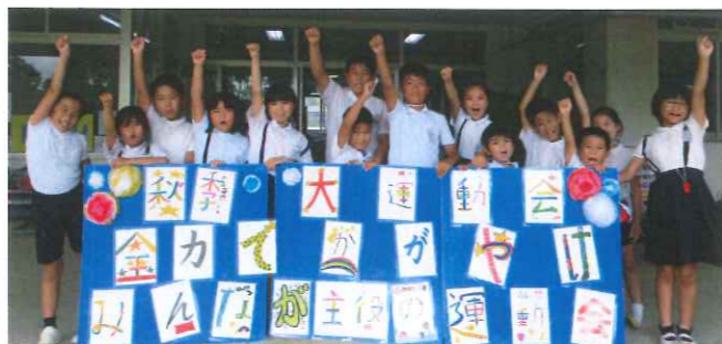
14人全員で考えたスローガン

「なぜだろう」があるから授業は楽しいのです。一時間の学習の中で、自分事として学習が選択・決定できるからうれしいのです。一時間の学習を通して、自分の「変容」が分かったときに自信へとつながっていくのです。令和5年度のゴールに向かって、一歩前へ「プラス1」の改善を行っていきます。