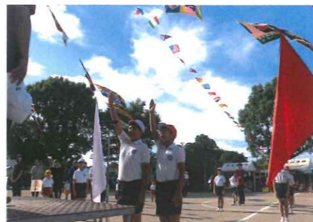
団長による力強い誓いの言葉