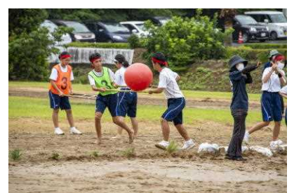
新競技「ボール運び」