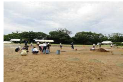
プログラム0番？「グラウンド整備」