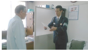
委嘱状を受取る園長

望洋の里は、事業に使用している自動車を十二台所有し、安全運転を遵守する活動が義務付けられている「安全運転管理事業所」に指定されています。そのうえ今年度は、頰娃地区のモデル事業所に指定され、一年間にわたり、他の事業所の模範となるよう安全運転管理協議会より指定を受けました。