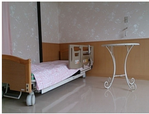
壁紙を換えリフレッシュした居室

特別養護老人ホームは平成元年に開所して二十八年が経過しました。その間に屋根の防水工事と外壁の塗装やエアコンの交換、最近では天窓の交換など、修理や小規模な改修を行ってきましたが、今年は居室（ご利用者の部屋）の壁紙交換を始めました。今までは、白一色だったものを、床よりメートルほどの部分を木目調にし、その上は、うつすらと花柄が入った壁紙にデザインを変更しました。写真にあります