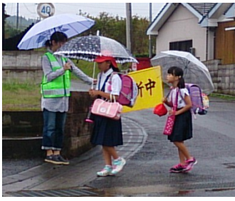
小学生を見守る職員

この指定を機会に、全公用車にドライブレコーダーを設置して、運転者に「運転を他の人に見られている」と意識付けをして更に注意深い運転を心がけてもらい、秋の交通安全運動期間には、約一週間、朝の通学時間帯に職員が交代で、交通安全立哨を行いました。モデル指定が終わる来年以降も交通事故を起こさない事業所づくりに邁進する所存です。