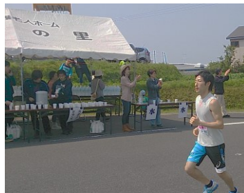
望洋の里の給水場

当日は五百名分の飲み物を準備し、各ランナーの方々に配布しました。多くのランナーが立ち寄って下さり、立ち去る時には「ありがとう」と言ってお下さる方、大きく手を振って下さる方などおられ、楽しく交流を図る事が出来ました。